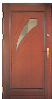
Inplast LE WK 24