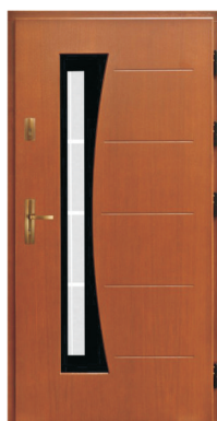
Inplast LE EX 06