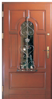
Inplast LE WK 22