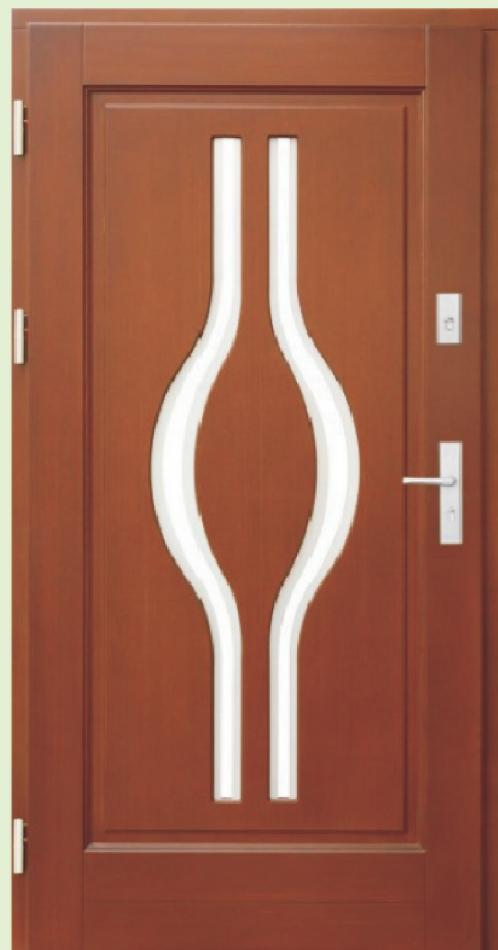
Inplast LE WK 23