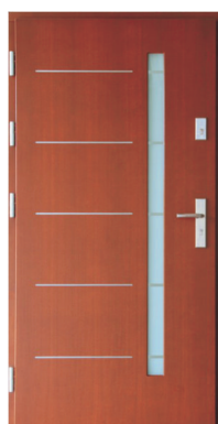
Inplast LE EX 03