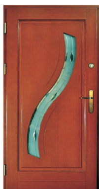
Inplast LE WK 28