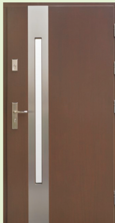
Inplast LE EX 08