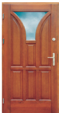
Inplast LE WK 08