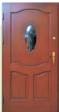
Inplast LE WK 05 a