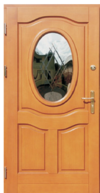
Inplast LE WK 05