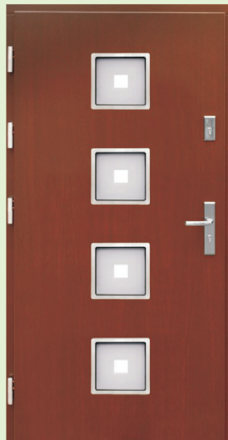
Inplast LE EX 04