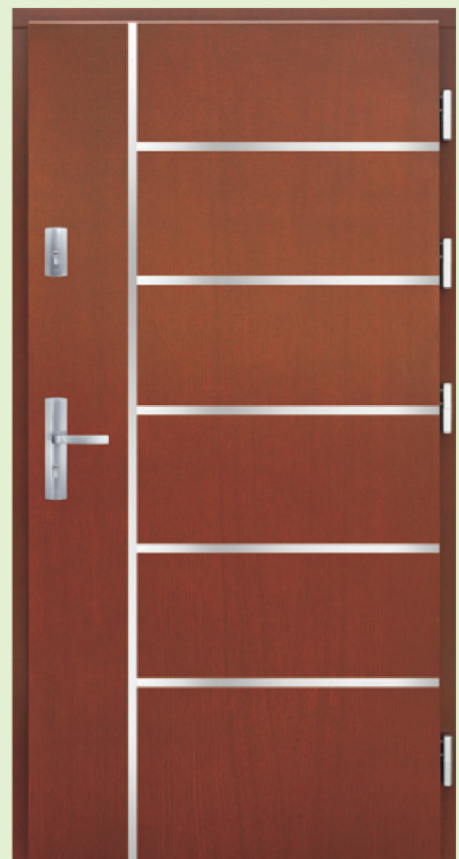
Inplast LE P 03