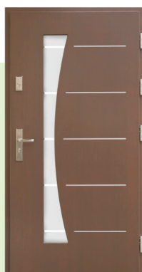
Inplast LE EX 10