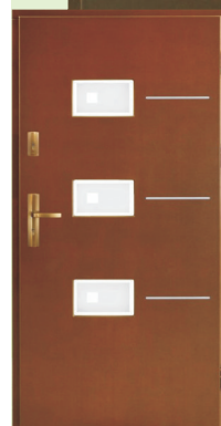
Inplast LE ZP 03