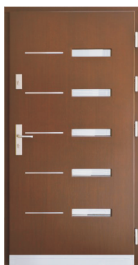
Inplast LE EX 05