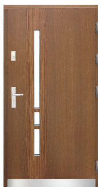
Inplast LE EX 18