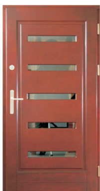
Inplast LE WK 16