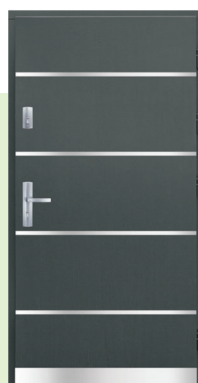
Inplast LE P 02