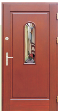
Inplast LE WK 19