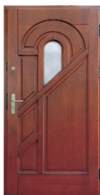
Inplast LE WK 02 b