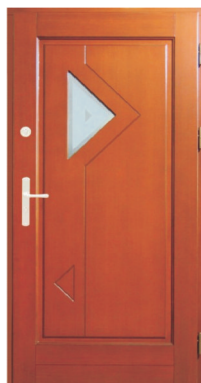
Inplast LE WK 21