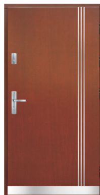
Inplast LE P 01