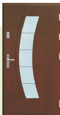
Inplast LE EX 24 i