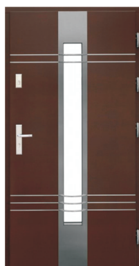
Inplast LE EX 15