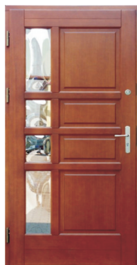
Inplast LE WK 01