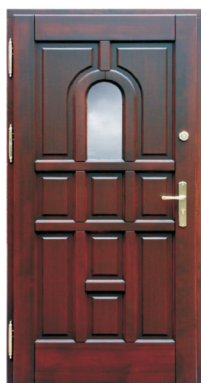
Inplast LE WK 04