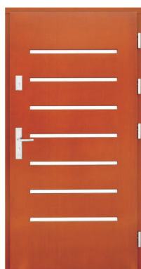
Inplast LE EX 12