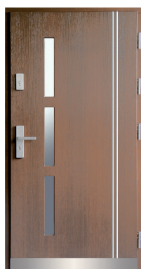
Inplast LE EX 13 b