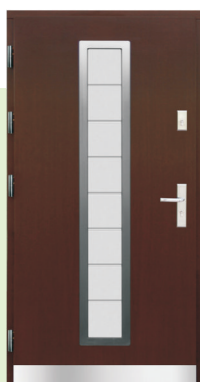
Inplast LE EX 09