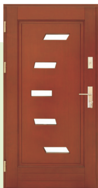
Inplast LE WK 31