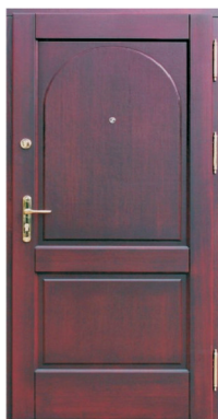
Inplast LE WK 10