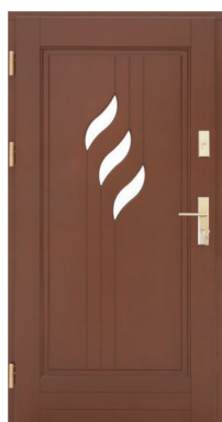
Inplast LE WK 29