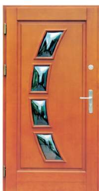
Inplast LE WK 14