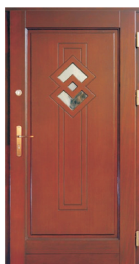
Inplast LE WK 26