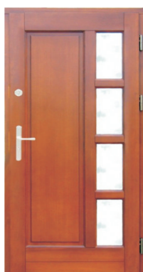
Inplast LE WK 12