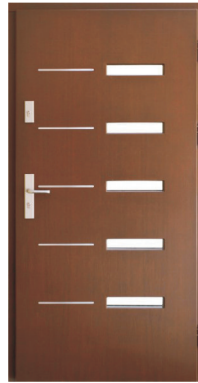
Inplast LE ZP 01