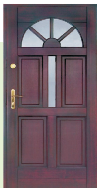
Inplast LE WK 06 a