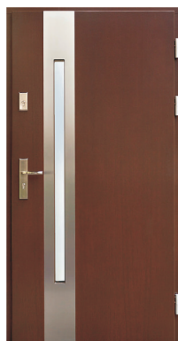
Inplast LE ZP 08