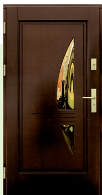
Inplast LE WK 17 as