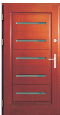
Inplast LE WK 16 a