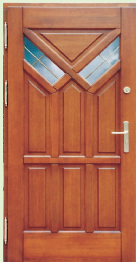
Inplast LE WK 03