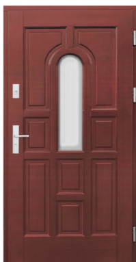
Inplast LE WK 04 b