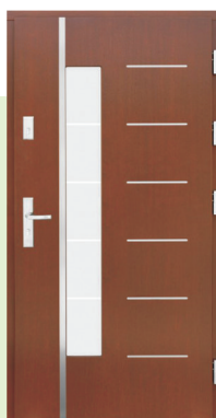
Inplast LE EX 11