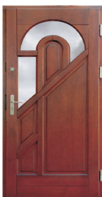
Inplast LE WK 02 a