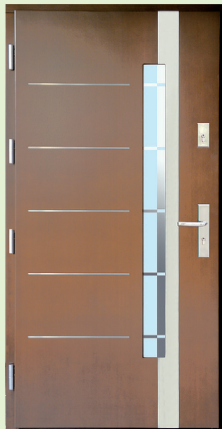
Inplast LE EX 16 a