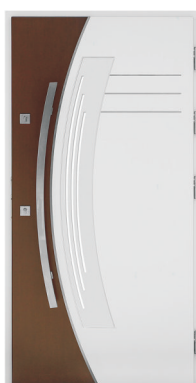
Inplast LE EX 14