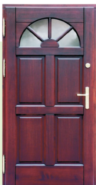
Inplast LE WK 06