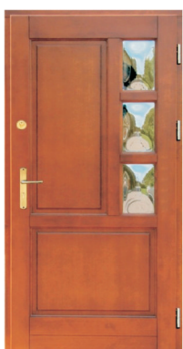
Inplast LE WK 13