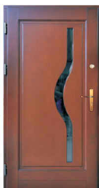
Inplast LE WK 25