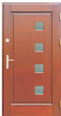
Inplast LE WK 20