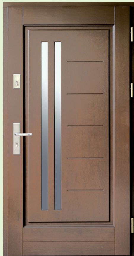
Inplast LE WK 33