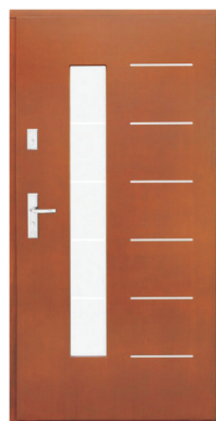
Inplast LE ZP 09