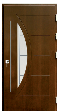
Inplast LE EX 01