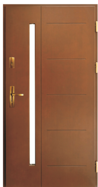
Inplast LE ZP 02