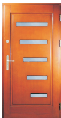
Inplast LE WK 15