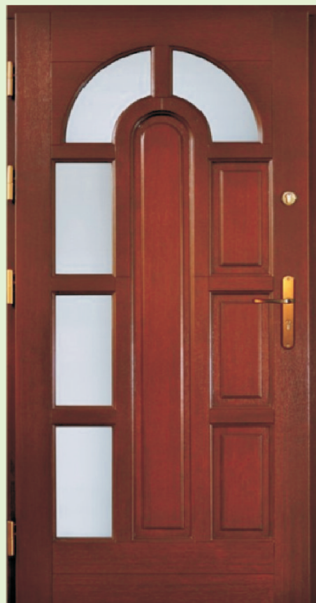
Inplast LE WK 11