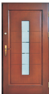
Inplast LE WK 27