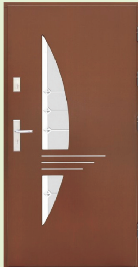
Inplast LE EX 17