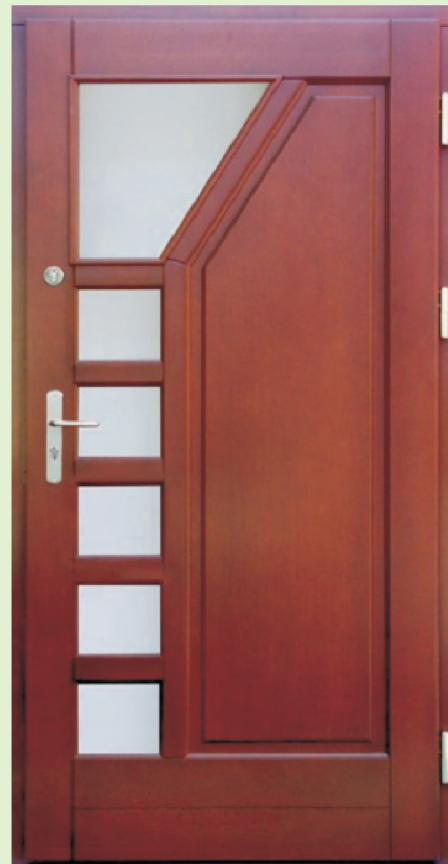
Inplast LE WK 07 a