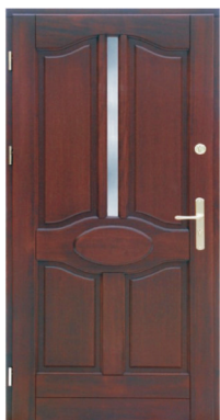
Inplast LE WK 09