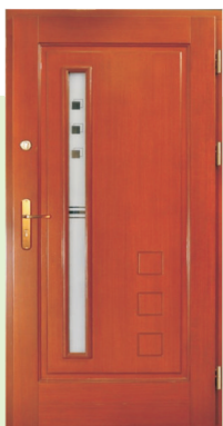
Inplast LE WK 18