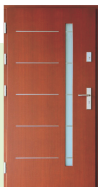
Inplast LE EX 20