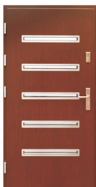
Inplast LE EX 02