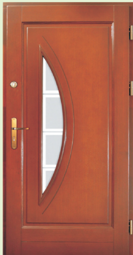
Inplast LE WK 17