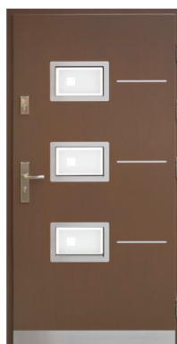
Inplast LE EX 07